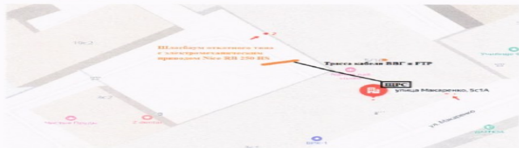
Рис. 1 Схема размещения шлагбаума