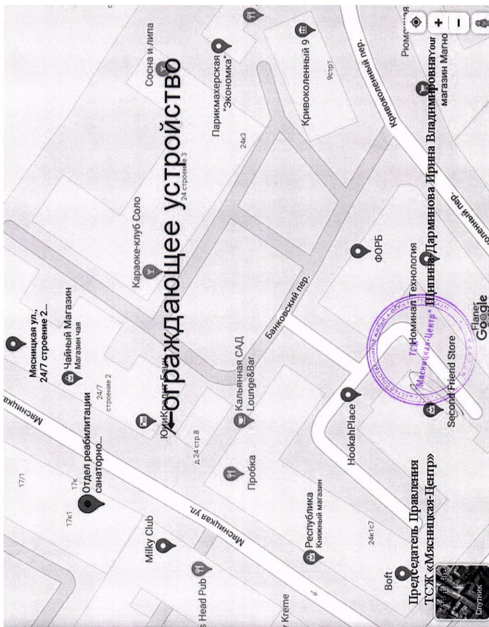
Схема расположения (визуализация) и размеры ограждающего устройства