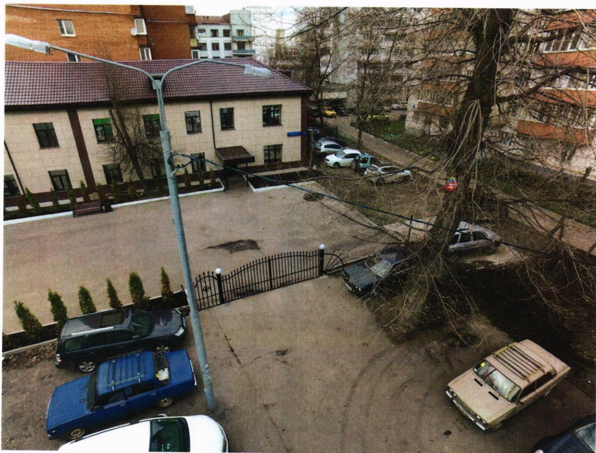
Схема размещения ограждающего устройства