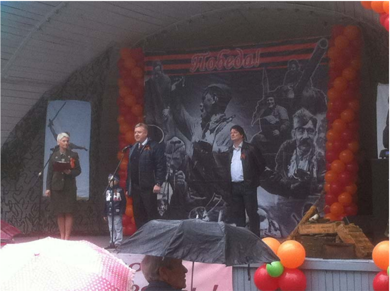
-День Победы в Саду им. Баумана