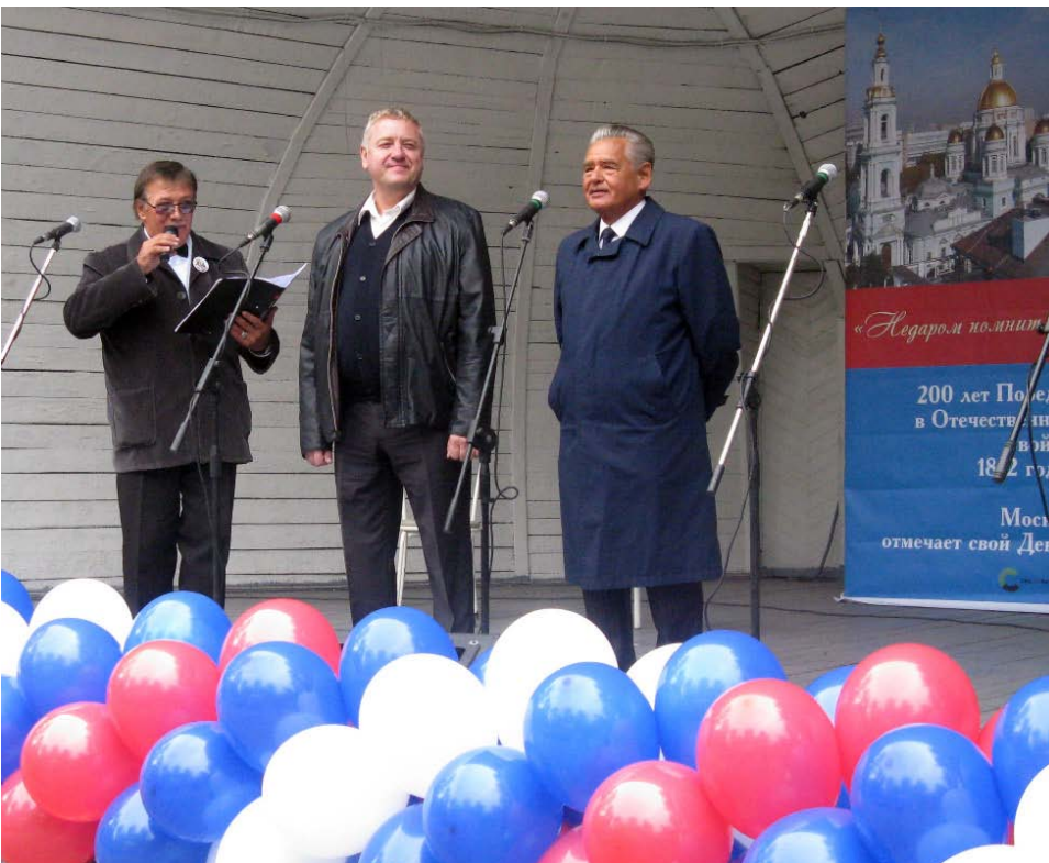
- День города в Саду им. Баумана