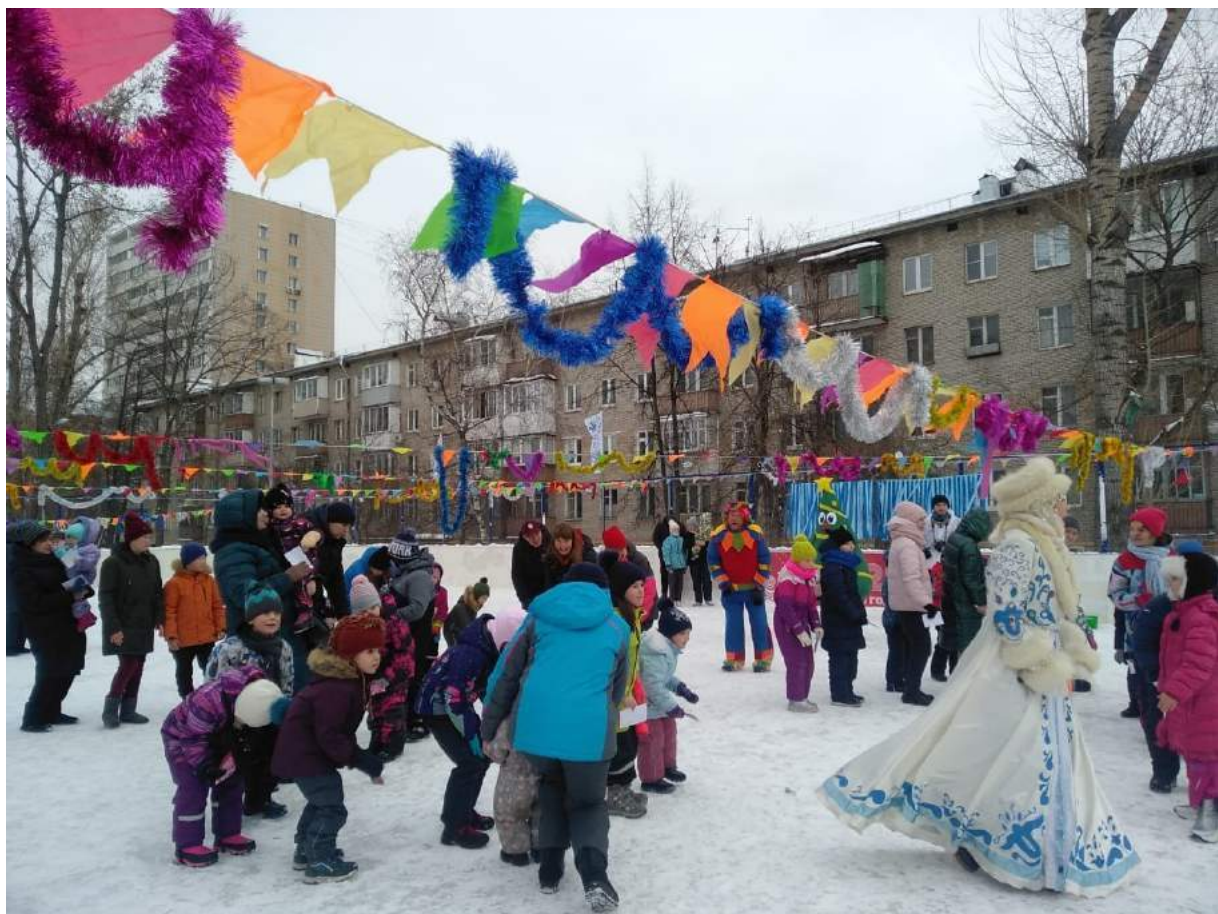
Новогодние поздравления для жителей Басманного района (спортивная площадка ул. Доброслободская дом 16)