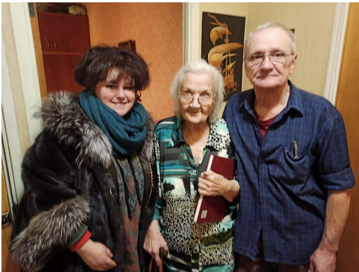
Поздравление жителей на дому в дни памятных дат «Битва под Москвой»