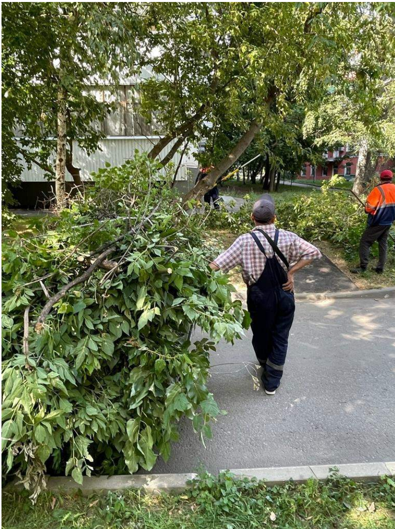
Проведение кронирования деревьев (Доброслободская дом 8)