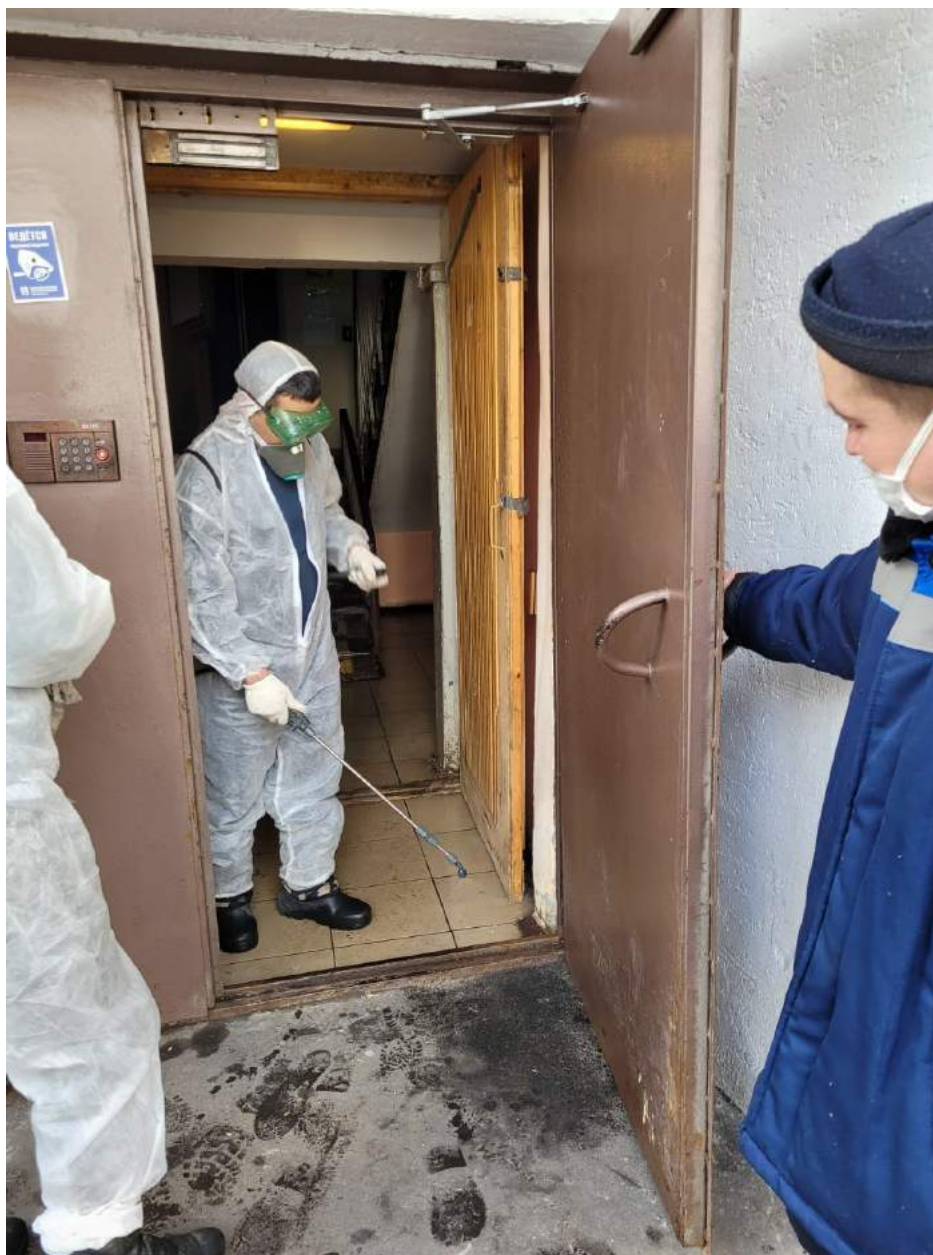
Организация проведения дезинфекции подъезда после выдворения лиц Бомж и затем внеплановый ремонт подъезда (ул. Спартаковская, д. 16 корп.2)