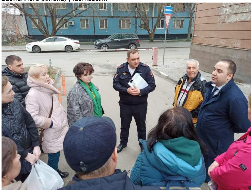
Встреча с жителей с руководством полиции Басманного района и участковым