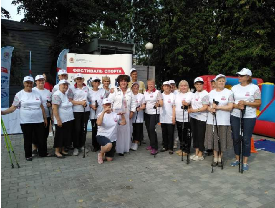
Участие в летних мероприятиях в саду им. Баумана (С командой «Басманные нордики»)