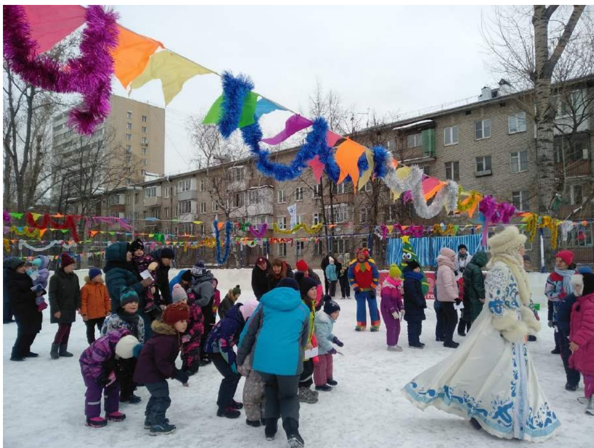
Новогодние поздравления для жителей Басманного района (спортивная площадка ул. Доброслободская дом 16)