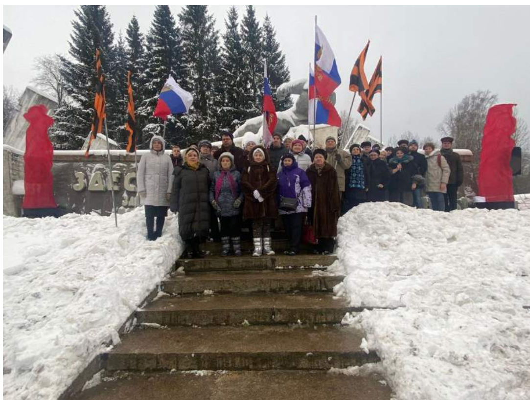
Поездка на 242 км Минского шоссе к Памятнику героям-ополченцам Басманного района.