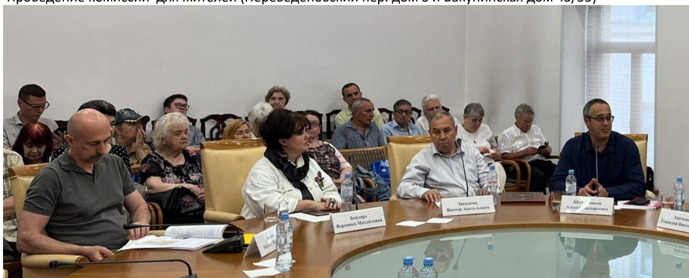
Участие в конференции, посвященной героям-ополченцам Басманного района.