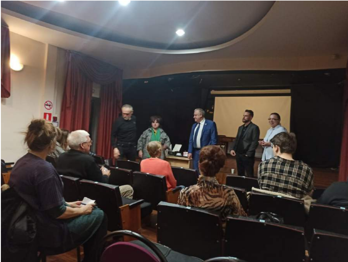
Встреча с жителями в Фонде «Филантроп»