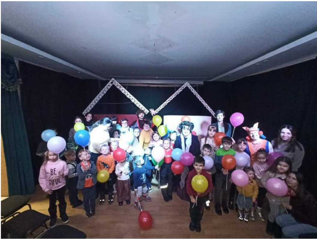
Организация мероприятия для семей с детьми Басманного района