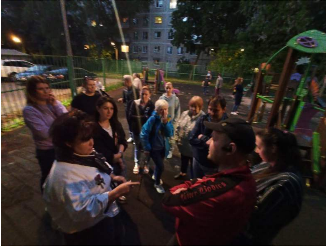
Встреча с жителями дома 43/55 по Бакунинской улице