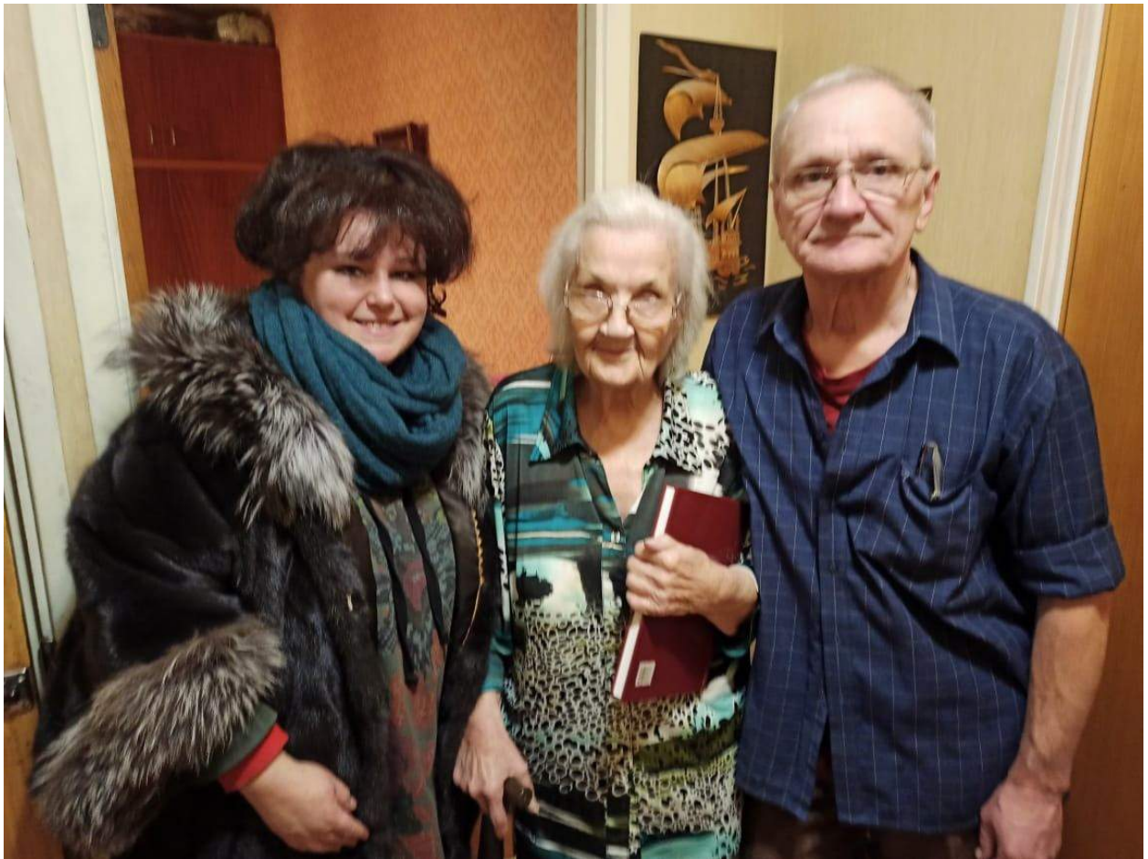
Поздравление жителей на дому в дни памятных дат «Битва под Москвой»