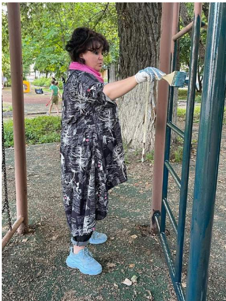
Приведение в порядок территории Басманного района