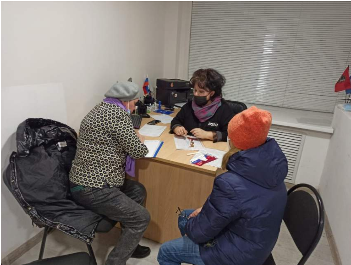
Прием жителей в отделении партии «Единая Россия»