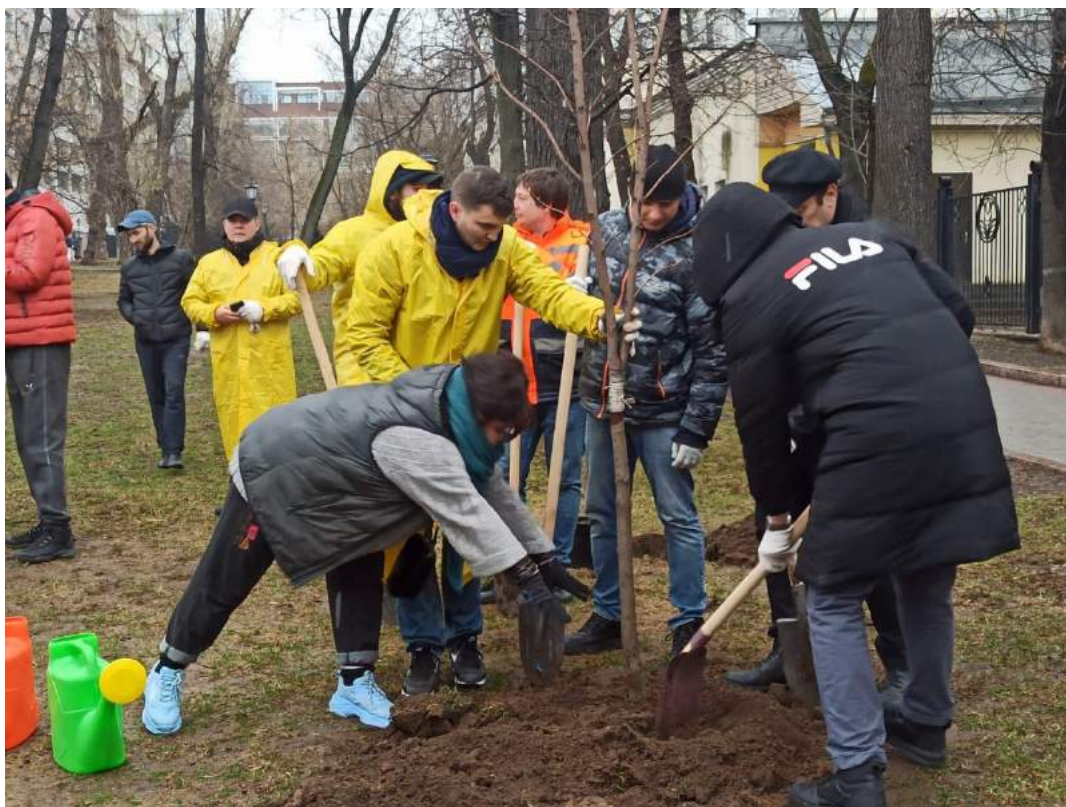
Весенняя высадка деревьев в Милютинской парке (Новорязанская ул.)