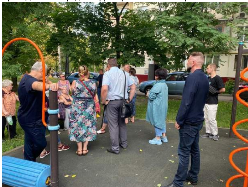
Встреча с жителями (Сыромятники)