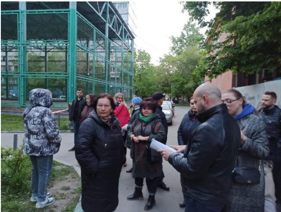
Организация встреч с жителями в ходе работ по благоустройству МКД по адресу: Переведеновский пер., д 4