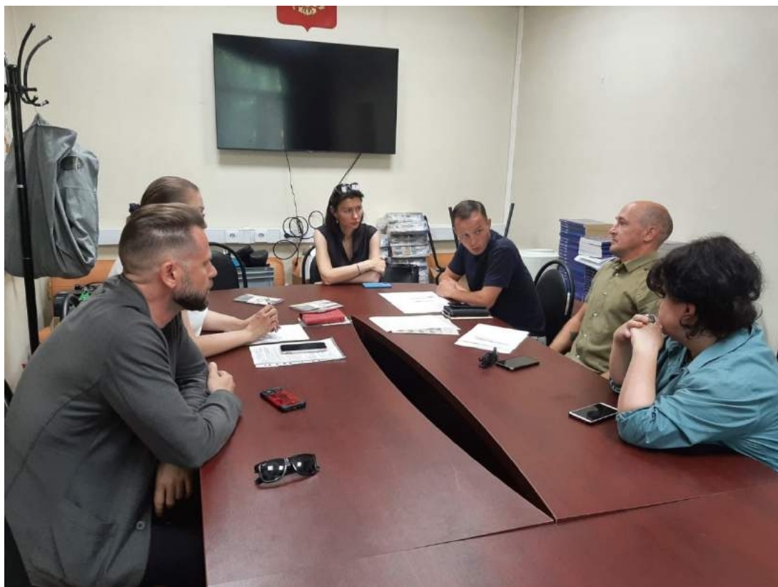
Проведение комиссии для жителей (Переведеновский пер. дом 3 и Бакунинская дом 43/55)