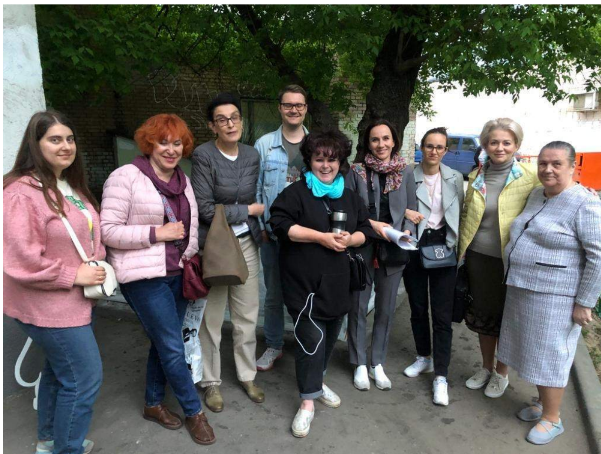
Встреча с жителями (ул. Спартаковская, д. 16 к.2)