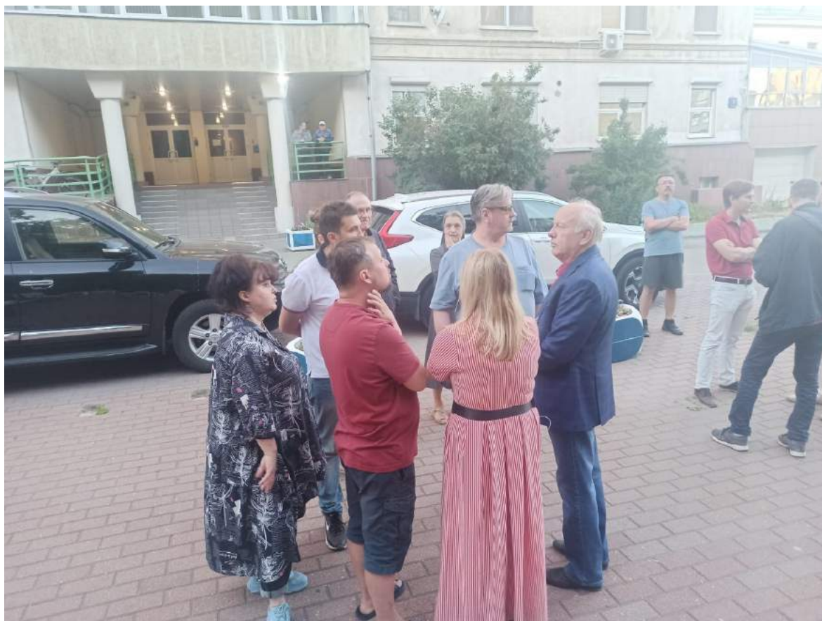
Работа в команде с жителями по благоустройству придомовой территории дома 3-5 по Бригадирскому переулку.