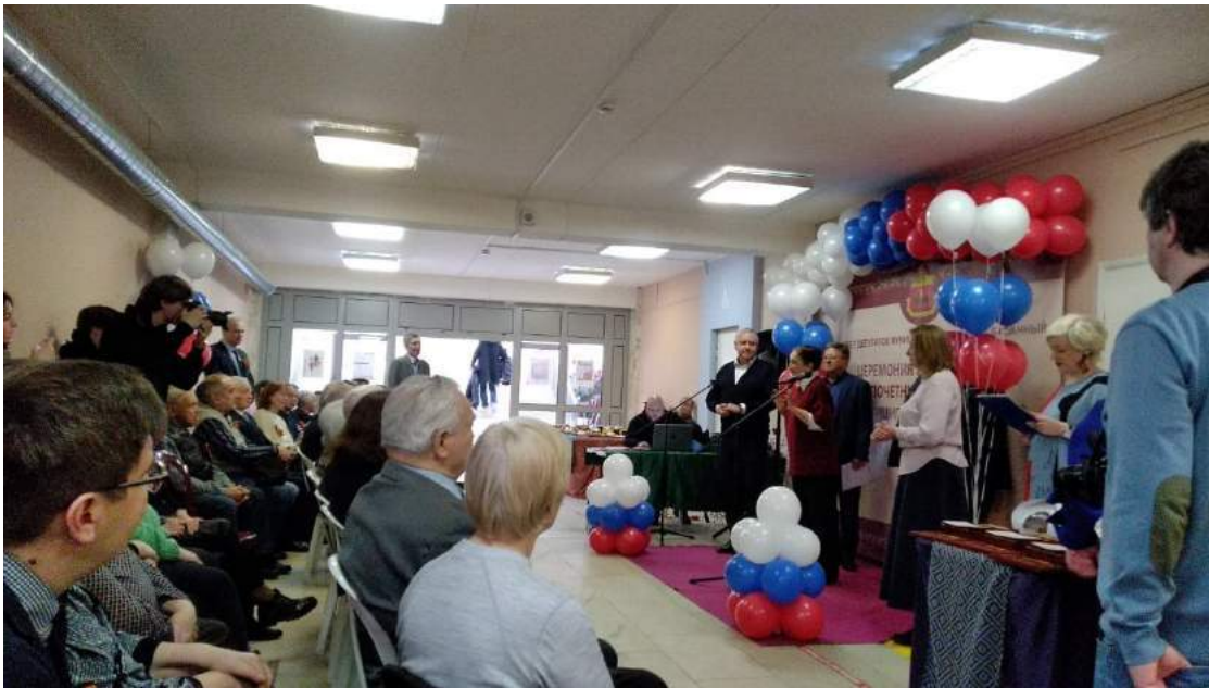
Церемония награждения Почетным званием «Почетный гражданин муниципального округа Басманный»