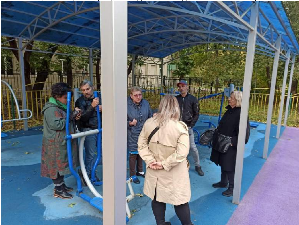
Организация встречи жителей с представителями Управы и организацией по проведению капитального ремонта (Елизаветинский пер. 6)