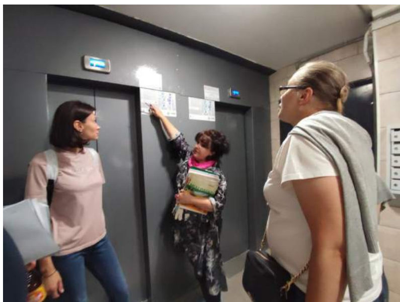
Проверка работы лифтового оборудования