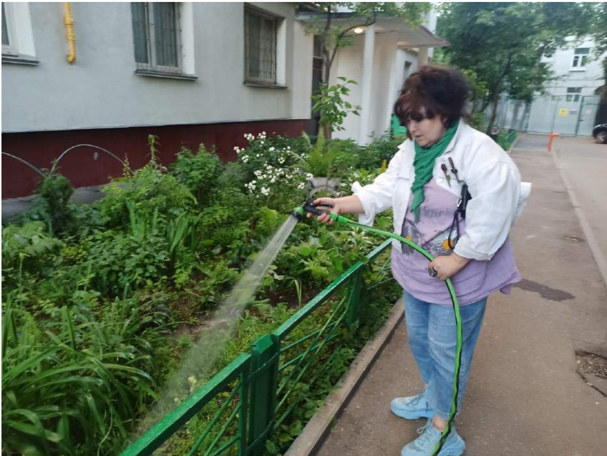
Организация полива в летний период (ул. Доброслободская д. 4)