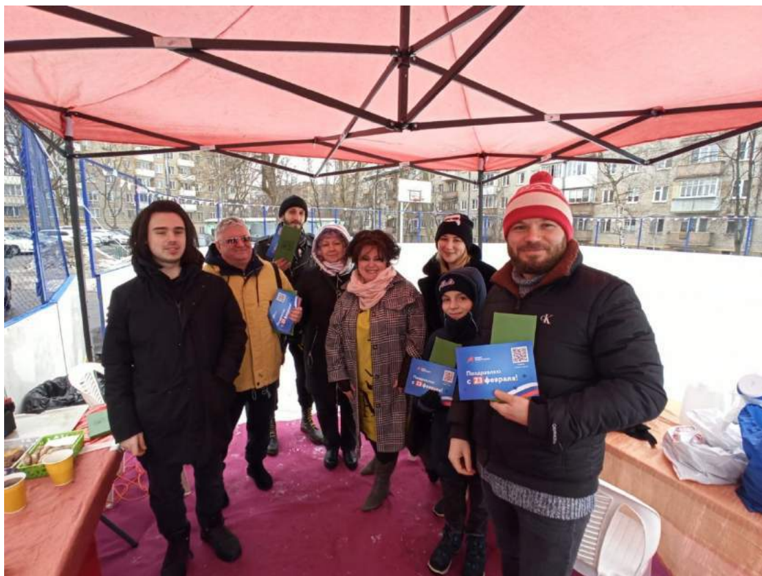
Поздравление жителей с 23 февраля