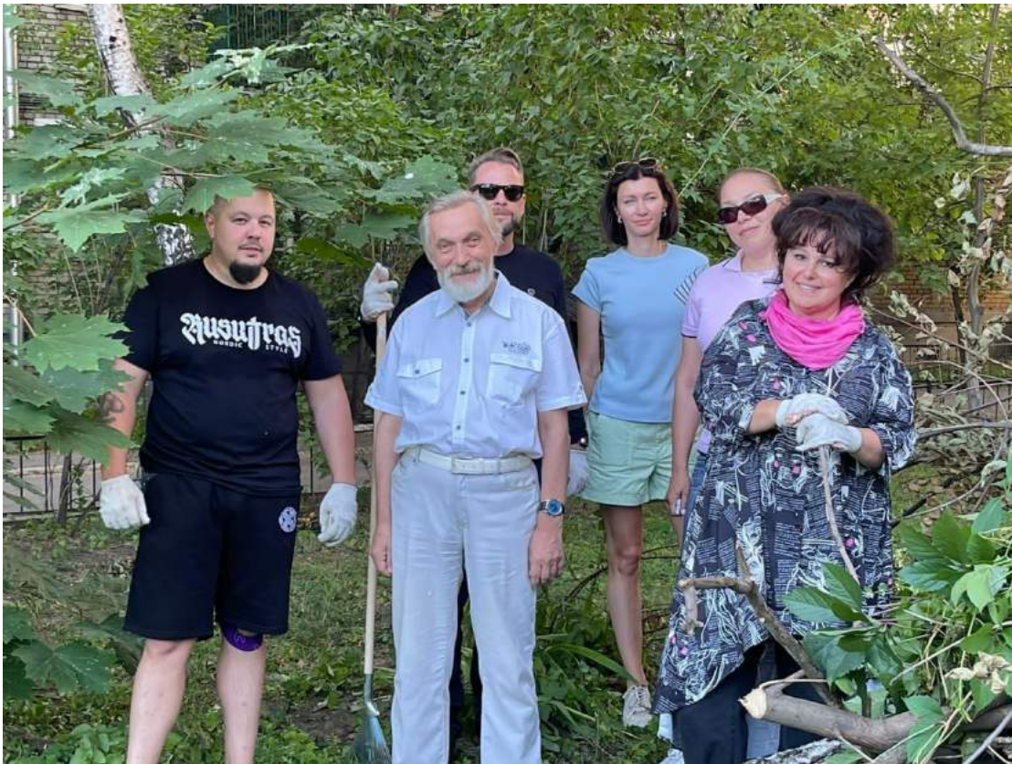
Участие в уборке придомовой территории ул. Казакова – по обращению жителей