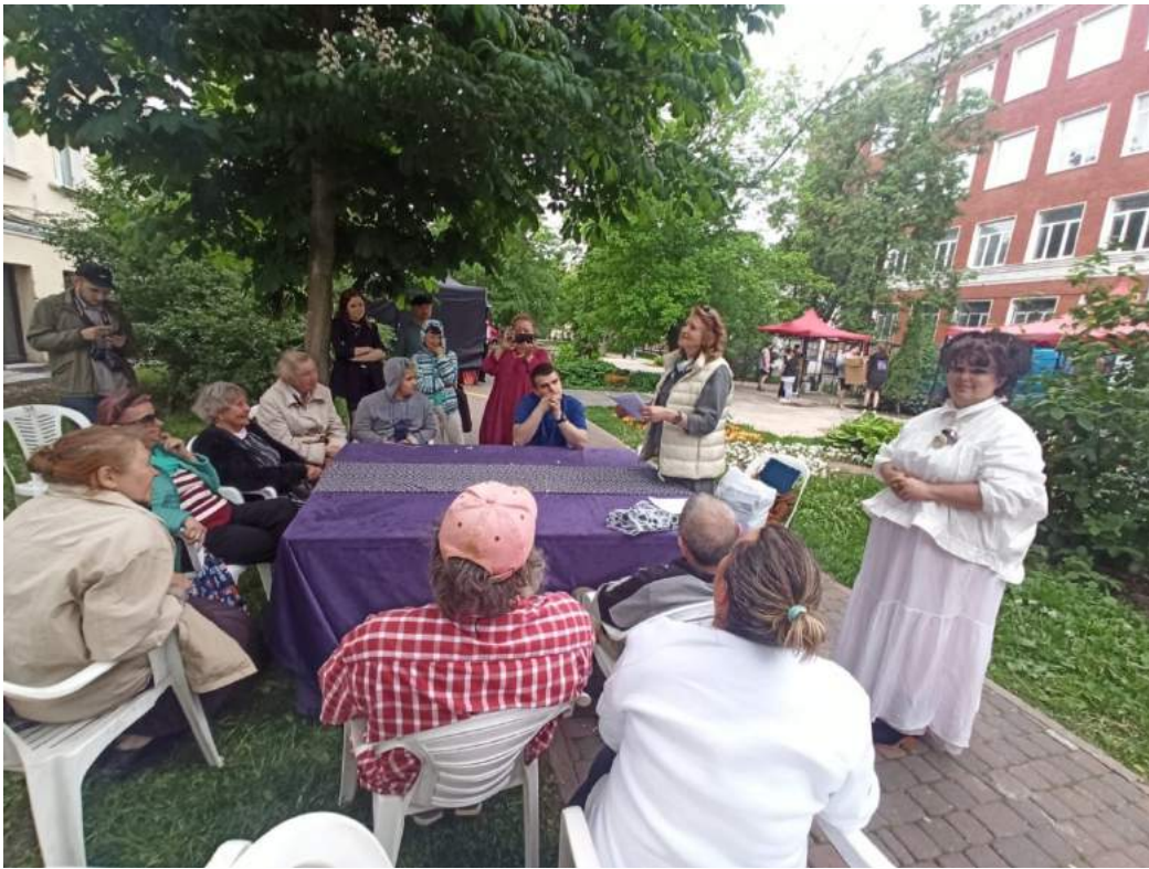
12 -и часовой марафон «Читаем Пушкина в многонациональном Басманном районе»