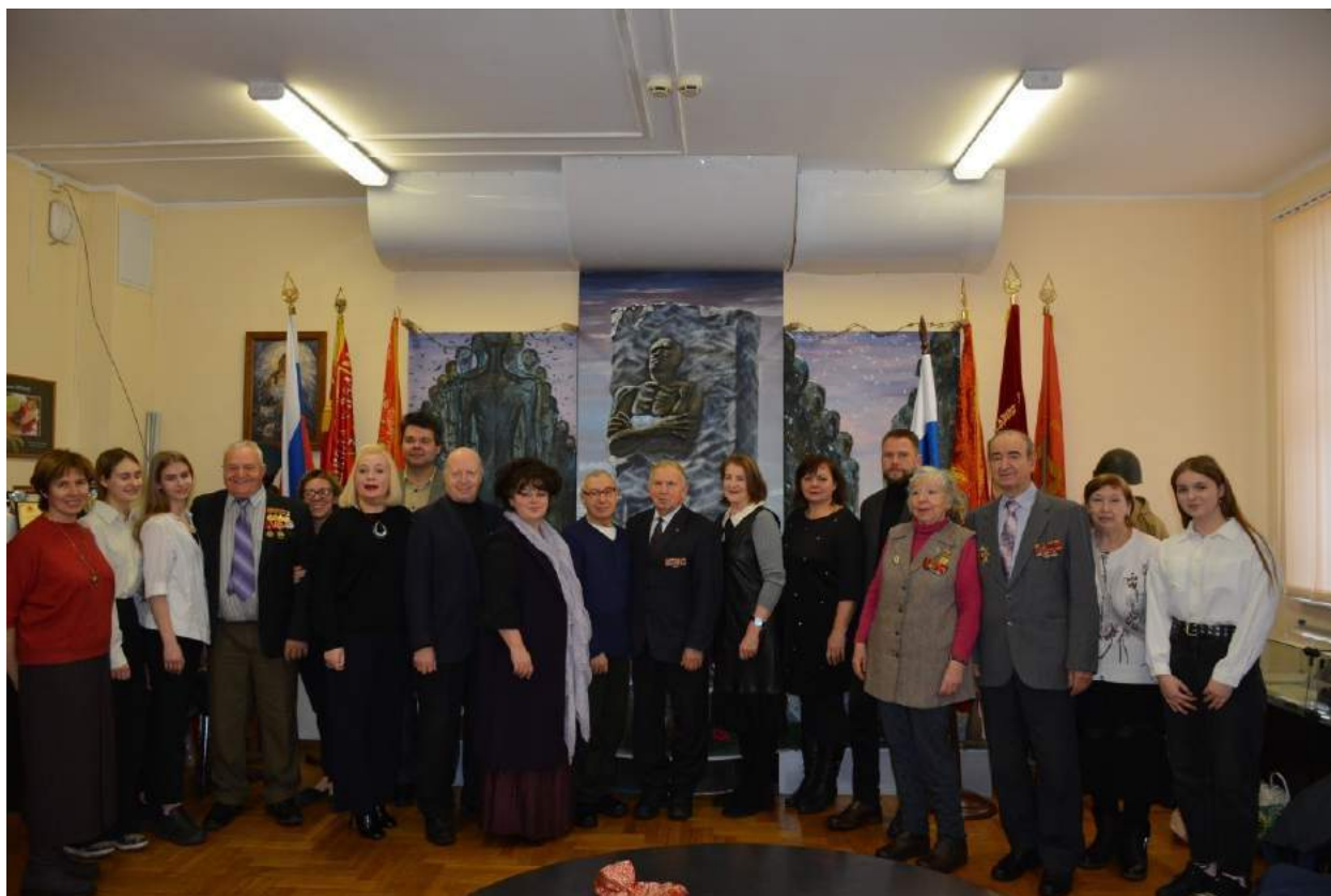
Школа им Карбышева «Урок мужества»

Приведу фотопримеры моей работы 2022 год.