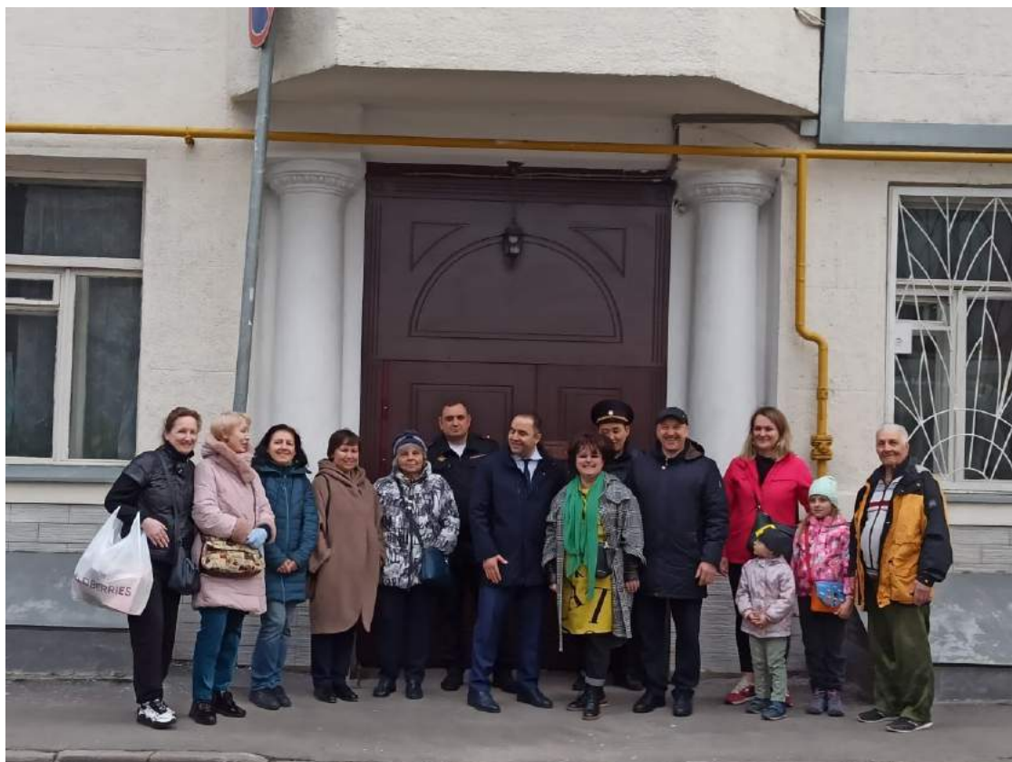
Встреча с жителями дома 4 по Переведеновскому пер. с руководством отделом полиции Басманного района, участковым.