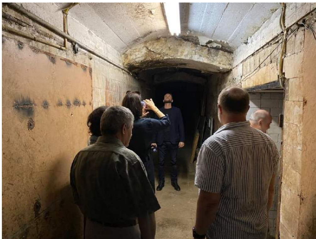
Проверка содержания подвалов в доме 35 по Бауманской улице.