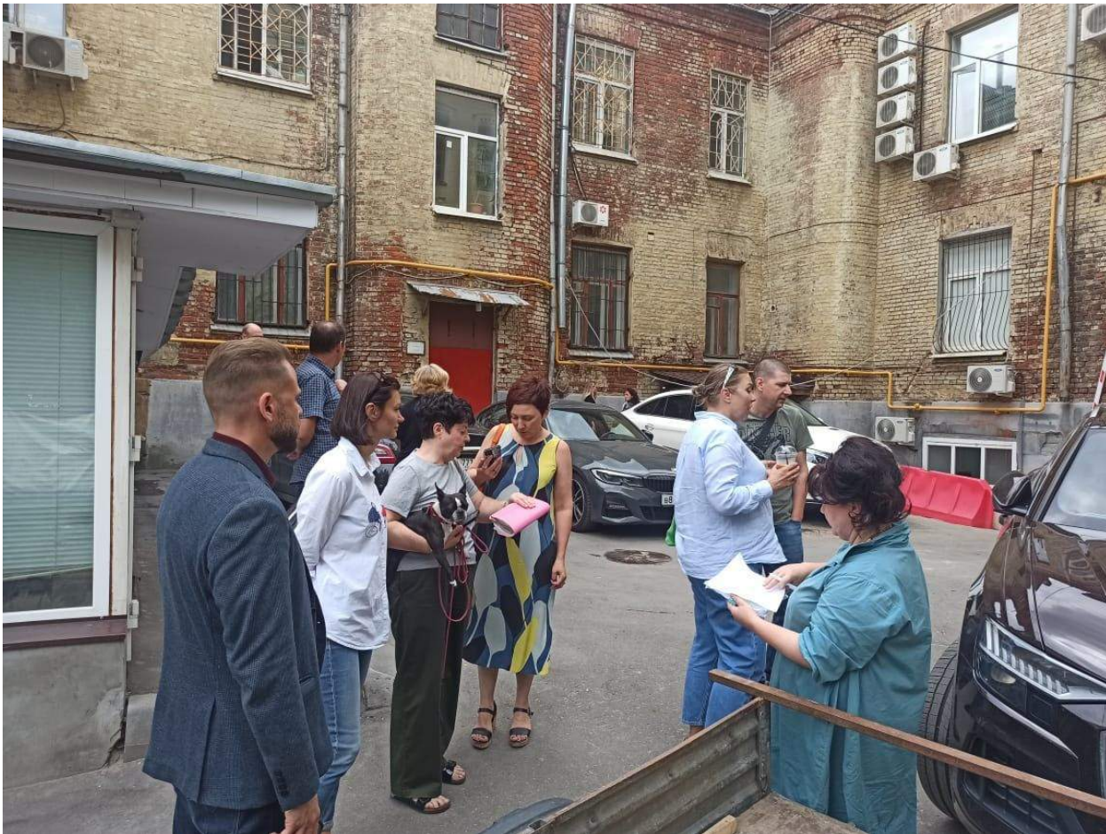
Комиссия по приемке работ по фасаду МКД по адресу:1-ый Басманный пер.д.4