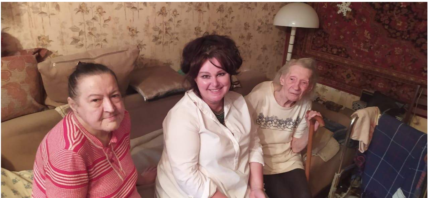
Поддержание хорошего на строения для наших жителей старшего возраста