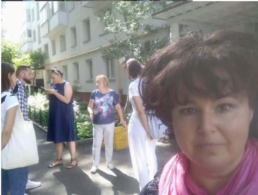
Обследование мусоросборных камер с жителями