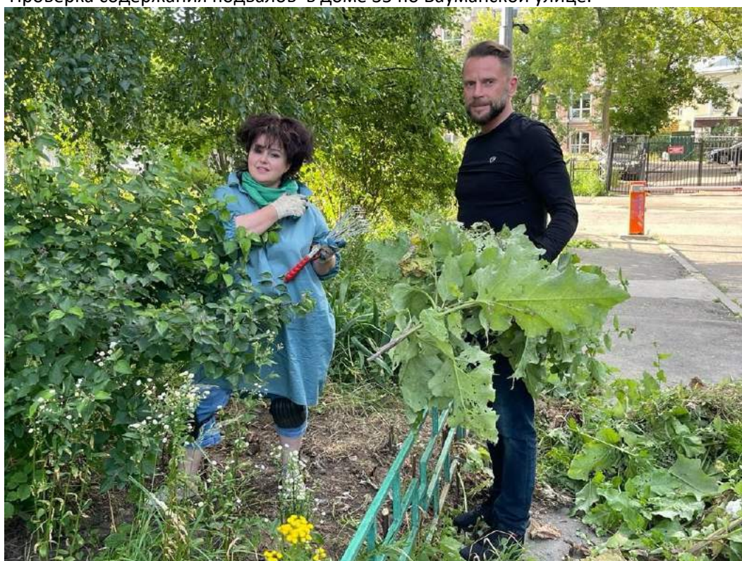
Приведение в порядок территории Басманного района