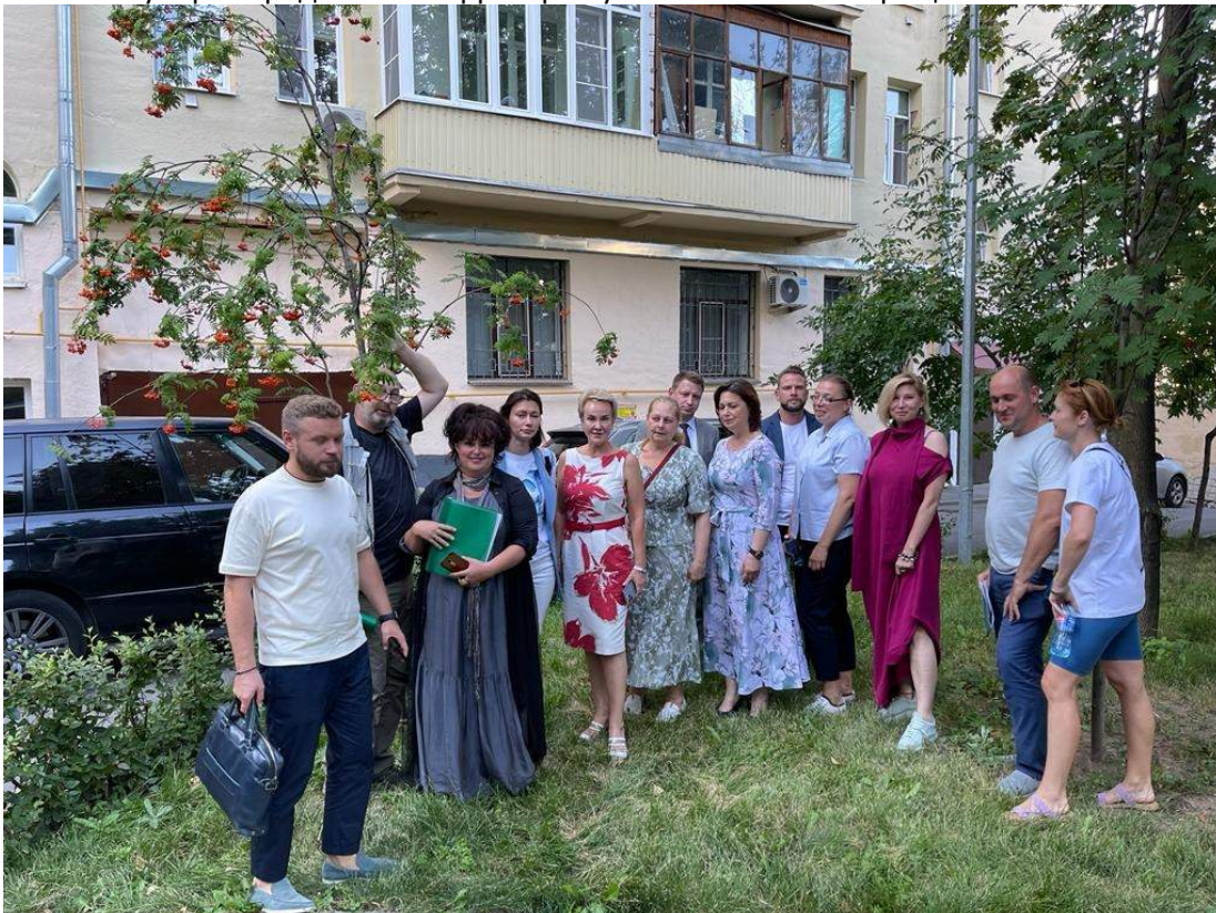
Участие в работе общего собрания по итогам проведения инспекционных выходов на придомовые территории с активистами Басманного района.