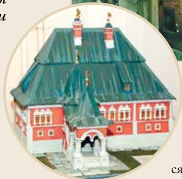
Дом Анны Монс и макет дома Анны Монс, каким он был в конце XVII века. Работа Николая Аббакумова из собрания народного музея «Слобода».

дом постройки. Палаты Анны Монс находятся в плачевном состоянии, и местное сообщество, разумеется, забило тревогу. Во-первых, велик риск, что на месте снесенных корпусов построят новые здания и исторический особняк окончательно сгинет на задворках новодела. Во-вторых, дом вполне может попасть под снос и сам — случайно или умышленно, разбираться будет уже поздно.